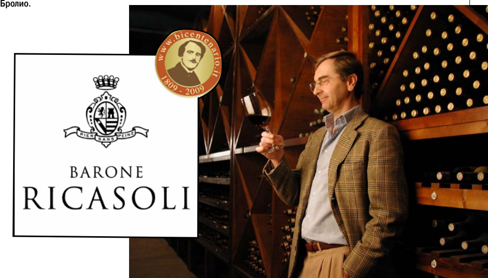
Барон Франческо Рикасоли.

ляет представитель 32-го поколения баронов Рикасоли — Франческо. Он свято чтит семейные традиции и открыл для осмотра лишь четыре зала дворца. Остальные считаются частными владениями и закрыты для публики.