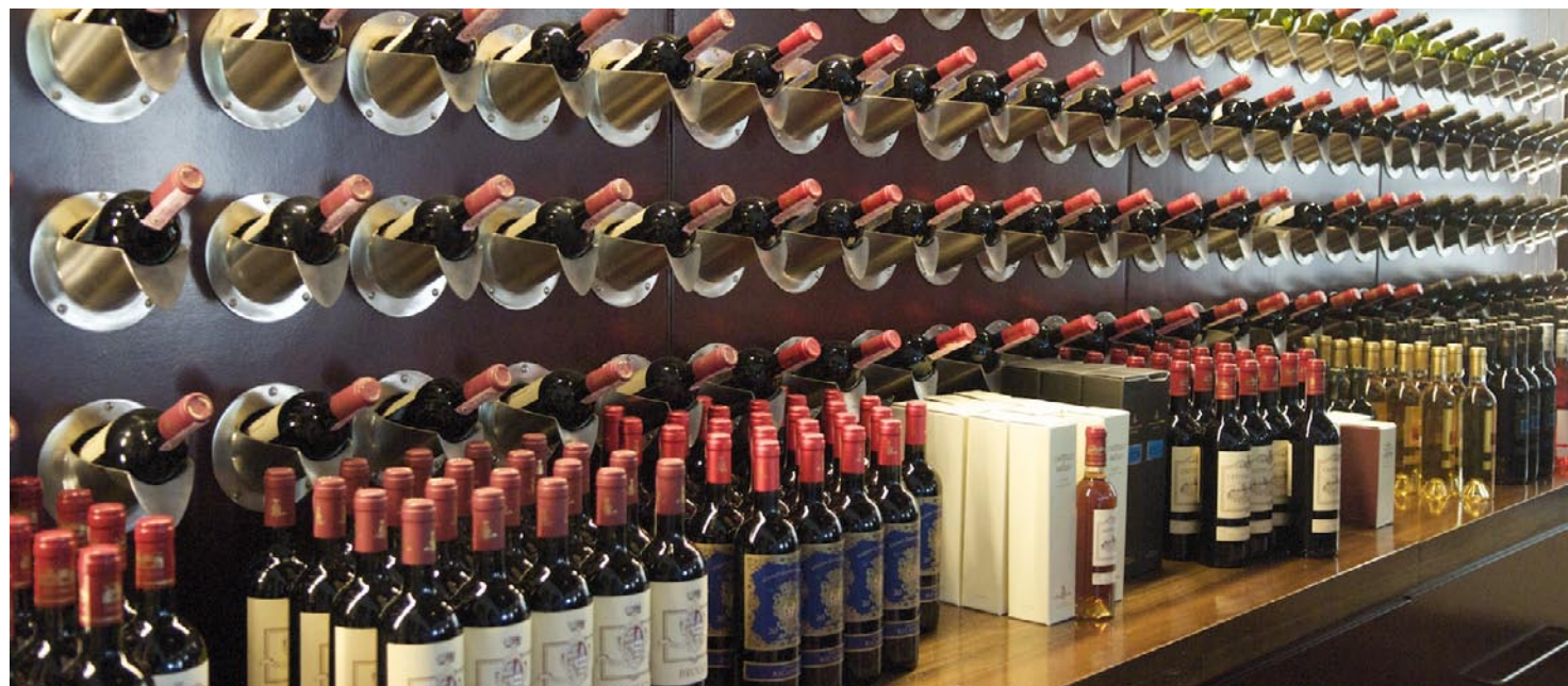
Магазин в замке Бролио.

Конечно, лучше всего приехать в замок Бролио и после прогулки по его территории отправиться на дегустацию вин и сделать закупки в фирменном магазинчике. А когда вы задумаетесь над тем, как теперь будете жить без лучшего винтажного Castello di Brolio, вступайте в местный винный «Клуб 1141» (назван по году основания замка).